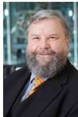
Ferdinand Wieger Leiter Transport Österreich

ERGO Versicherung AG Deutschland Niederlassung für Österreich Businesspark Marximum/Objekt 3 Modcenterstraße 17 1110 Wien